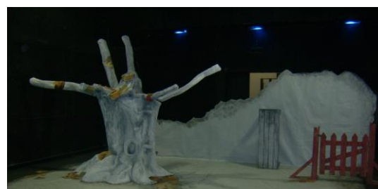
Bühnenbild aus „Peter und der Wolf“

Von dort ging es zurück nach Tel Aviv, wo wir im Seminar Hkibutzin eine Aufführung von „Peter und der Wolf“ sehen konnten.